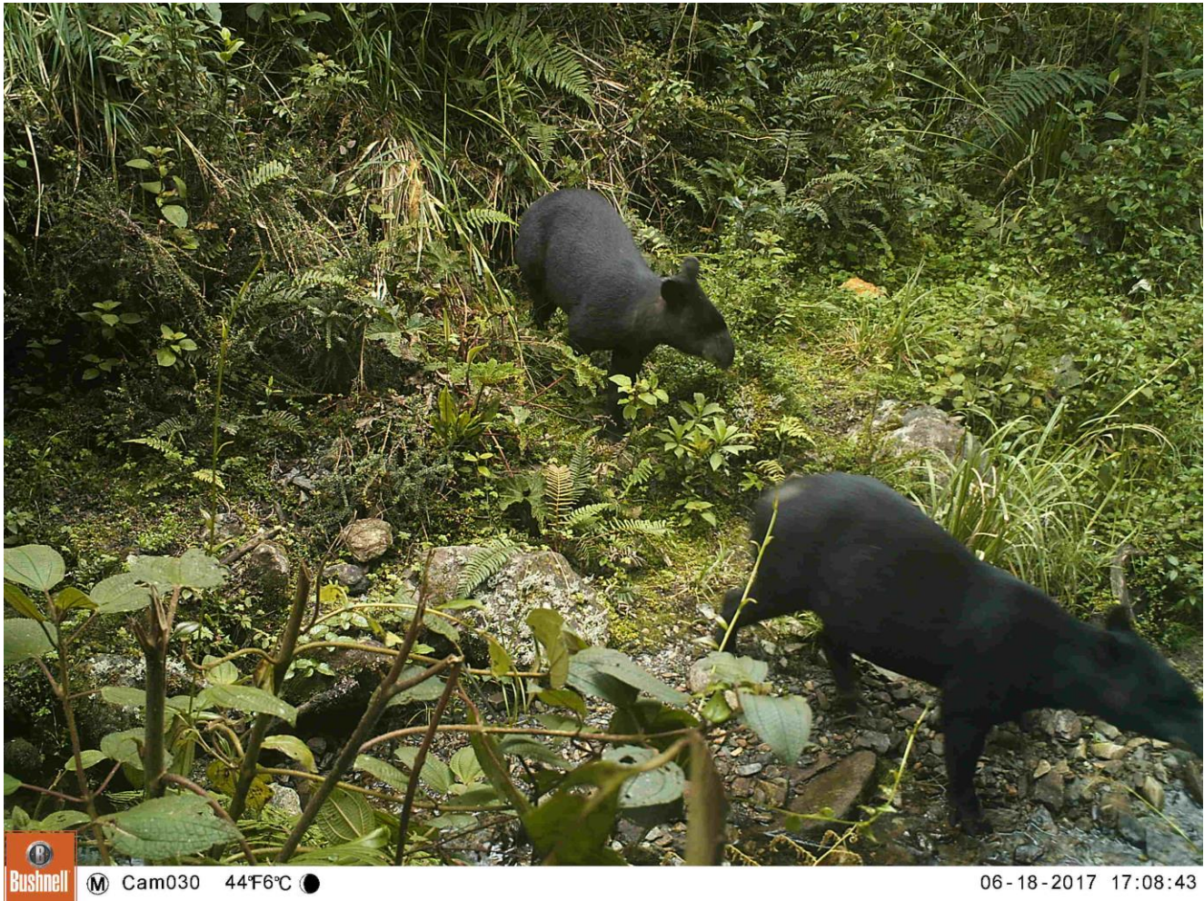
Figura 1. Registro de dos individuos de Tapirus pinchaque atravesando la Reserva Natural Estrella de Agua, Quindío, Colombia.

El nuevo registro de Tapirus pinchaque en esta nota aporta información relevante sobre la distribución confirmada de la especie en el Quindío, fuera del Parque Nacional Natural de los Nevados y hacia su zona de amortiguadora, y en especial en un páramo en excelente estado de conservación (Páramo de Frontino). Este páramo se considera que ha tenido poca presión antrópica, conservando su estructura y composición original, aunque vale la pena resaltar que, si bien tiene acceso restringido por parte de la CRQ, no hace parte del Parque Nacional Natural de los Nevados ni cuenta con una figura estricta de conservación. Las áreas no protegidas son de vital importancia para la conservación de grandes vertebrados, en especial en el marco de los escenarios de cambio global (Lizcano et al. 2015), por lo que este tipo de registros son importantes para diseñar estrategias de conservación de especies carismáticas y de paisaje como el tapir. Teniendo en cuenta este nuevo registro, se sugiere evaluar las posibles rutas de conexión entre estas áreas de forma que se asegure su papel en los ecosistemas altoandinos del centro del país. Adicionalmente, se sugiere a las diferentes entidades ambientales de los departamentos limítrofes incluir estas zonas fuera de las áreas protegidas como áreas prioritarias para la conservación de la especie en Colombia.