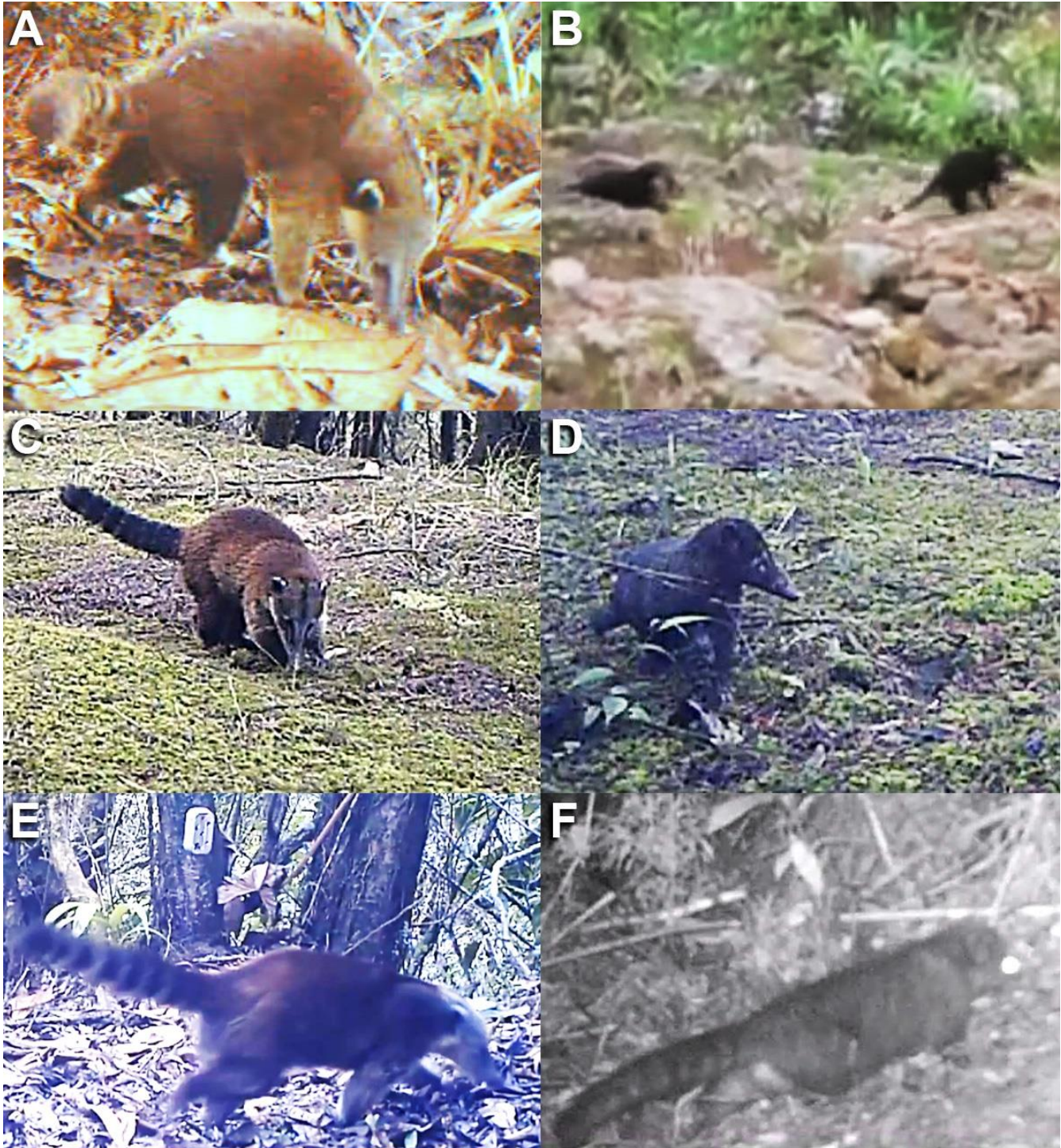
Figura 2. Individuos de Cusumbo Solo ( Nasua nasua ; A, C, E) y Cusumbo Mocosó ( Nasuella olivacea ; B, D, F) registrados en simpatria el Valle de Aburrá. A y B. registros en la Reserva San Sebastián la Castellana (municipios de Envigado-El Retiro); C y D. Alto de San Miguel (municipio de Caldas); E y F. Alto de la Romera (municipios de Sabaneta-Envigado).