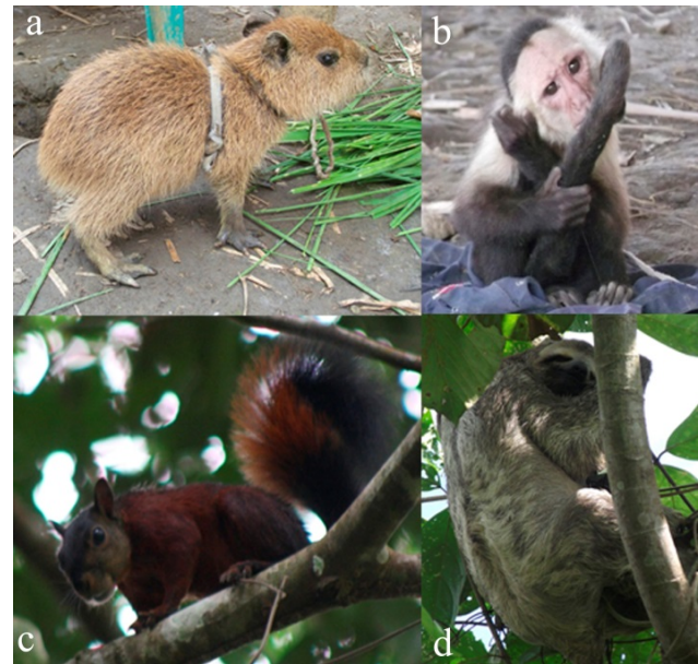
Figura 2. Algunos mamíferos presentes durante la caracterización ambiental de La Baja y Media Mojana entre el 2011 y el 2012, en los departamentos de Sucre, Bolívar y Córdoba, Colombia. a) Juvenil de ponche ( Hydrochoerus isthmius ), b) Mico cara blanca ( Cebus capucinus ) mantenidos como mascotas en la vereda el Chopal y, c) Ardilla roja ( Sciurus granatensis ) y d) Perico ligero ( Bradypus variegatus ) especies comunes en los relictos de vegetación presentes en la zona.