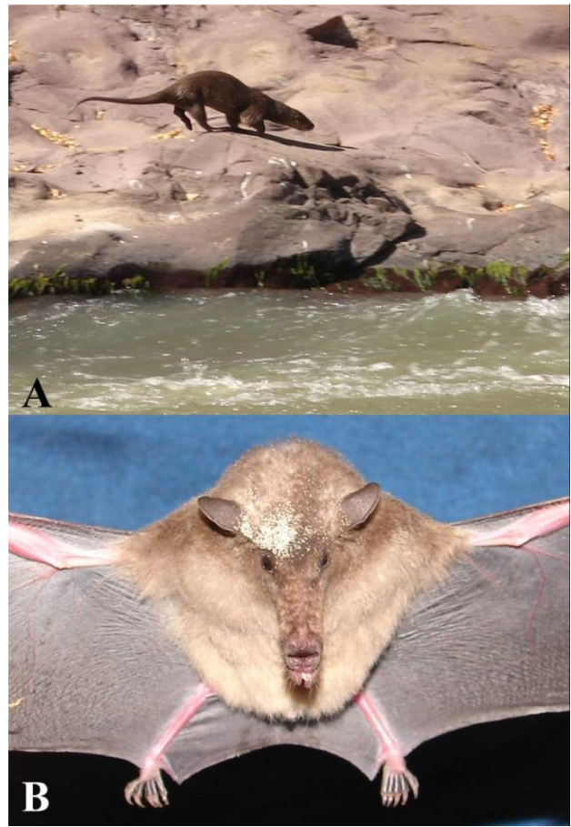
Figura 2. Nutria de río ( Lontra longicaudis ) y murciélago platanero ( Musonycteris harrisoni ) registrados en el área de estudio.

Finalmente es necesario que se efectúen estudios a lo largo de otras secciones de la barranca y a lo largo de los cauces de los ríos para poder confirmar su importancia como refugio de mamíferos y para la conectividad de las especies entre áreas de la región. El área requiere de atención de las autoridades estatales, ya que en ella se puede fomentar el turismo y conservar la fauna, requiriéndose una actualización su plan de manejo. Agradecemos a los propietarios de los terrenos aledaños al ANP. A los compañeros del Laboratorio de Vertebrados Terrestres Prioritarios y la Facultad de Biología (UMSNH) otorgó las facilidades para la preparación del manuscrito. Charre-Medellín agradece a CONACyT por la beca otorgada (239248).