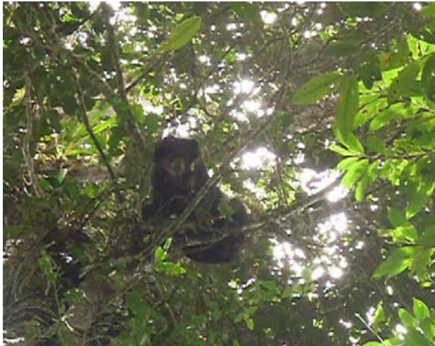
Figura 1. Primer registro confirmado de Tremarctos ornatus , por medio de video, para la Serranía de San Lucas, departamento de Bolívar, Colombia.