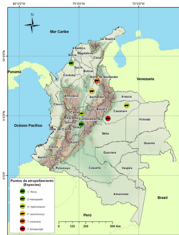
Figura 1. Distribución de los reportes de atropellamiento por especie en Colombia. Fuente: MCS CONSULTORÍA Y MONITOREO AMBIENTAL S.A.S, 2014