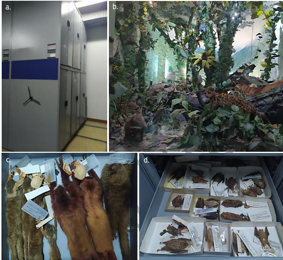
FIGURA 1. Colección de referencia científica y de exhibición del Museo de Ciencias Naturales Federico Carlos Lehmann. a. Almacenador de ejemplares de referencia científica. b. Dioramas con especímenes de exhibición. c - d. Especímenes de la colección de referencia científica IMCN.

La Colección de Mamíferos del Museo Departamental de Ciencias Naturales Federico Carlos Lehmann Valencia (IMCN) está ubicada en Cali – Valle del Cauca y su creación data de 1963. Actualmente, hace parte de las colecciones zoológicas de referencia científica del INCIVA - Instituto para la Investigación y la Preservación del Patrimonio Natural y Cultural del Valle del Cauca (Figura 1).