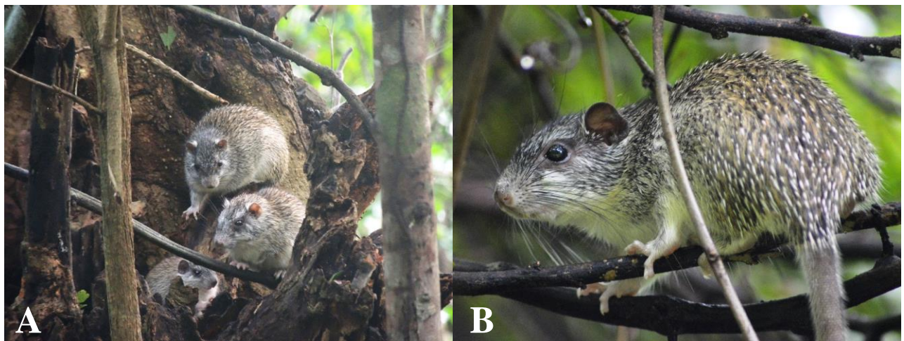
Figura 2. Registro fotográfico del (A) grupo familiar de Pattonomys semivillosus y (B) de un individuo observado sobre un árbol de matarratón ( Gliricidia sepium ).