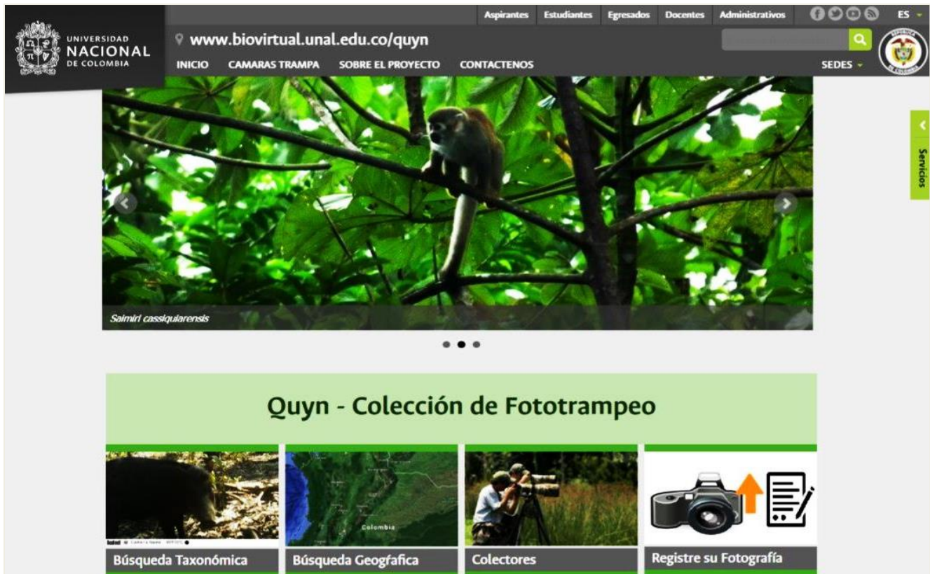
Figura 1. Vista de la página de inicio de la plataforma QUYN.

Para el manejo de la plataforma se establecieron parámetros para la inclusión de registros, evitando así incorporar especies bien documentadas en colecciones, especies con altos niveles de muestreo o especies que mediante un registro fotográfico no es posible corroborar su identificación taxonómica. A QUYN se puede acceder a través de la página http://www.biovirtual.unal.edu.co/quyn . En la página de inicio (Figura 1) se puede realizar una búsqueda según tres tópicos (i.e., taxón de interés, localidad específica o colector), adicionalmente se pueden cargar fotografías o videos llenando un formulario con la información básica del registro como datos de la cámara y de la fotografía.